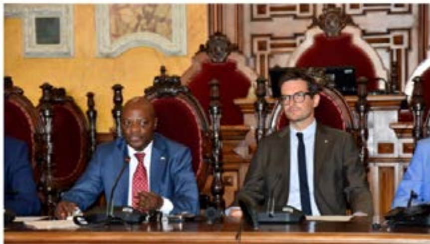
Il sindaco di Parma, Michele Guerra, con il sindaco di Bujumbura, Jimmy Hatungimana

Parma è protagonista, dal 2004, in Burundi con la realizzazione di uno strategico centro agroalimentare a cui è stato destinato un importante finanziamento di un milione e 700.000 euro destinato alla realizzazione di una filiera del pomodoro in Africa centrale