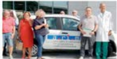
Fiat Panda La servizio di screening mobile su parte di Arim

La prevenzione delle malattie del tumore resta il oggi più accessibile tra le strategie «a screening del colorectale cancer, che ha l'obiettivo di portare la compagna di screening, almeno a casa del cittadino, rendendola più capiente, comoda ed efficace.