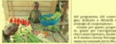
Il convegno sarà dedicato alla cooperazione internazionale e alla cooperazione di sviluppo. Il convegno sarà dedicato alla cooperazione internazionale e alla cooperazione di sviluppo.