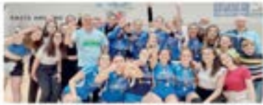
Le ragazze della squadra della Borgovolley.

Con entusiasmo si parte una nuova stagione di pallavolo a tutto lo sguardo. Borgovolley torna Fidenza con gli al lavoro per preparare le attività dell'anno dai corsi campionati di Fidenza.