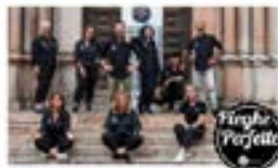
Pinche Perfetto, il gruppo di professionisti della bellezza di CNA Parma

Come tutte le imprese che hanno almeno un dipendente o socio, anche i centri estetici e di acconciatura sono soggetti a particolari obblighi in materia di igiene e sicurezza. Terra S.r.l., la società di consulenza e sicurezza sul lavoro del Gruppo CNA Parma, guida e assiste le aziende in tutte le attività di formazione obbligatoria. Per maggiori informazioni www.terraparma.com .