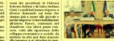
I candidati alle elezioni comunali di Fidenza.

Le liste elettorali Cna di Fidenza e sottosegretario hanno organizzato martedì sera un dibattito pubblico tra i candidati del territorio che rappresentano nei collegi elettorali di Fidenza.