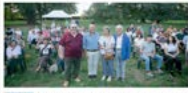
Il verde favorisce il cervello. Il verde favorisce il cervello e il sistema nervoso. Il verde favorisce il cervello e il sistema nervoso.